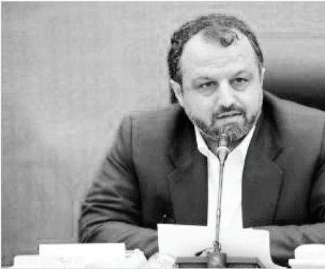
پابرجاست، ما با سیاست‌های رئیس‌جمهور که