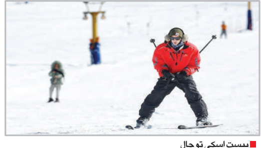
بیمست اسکی توچال