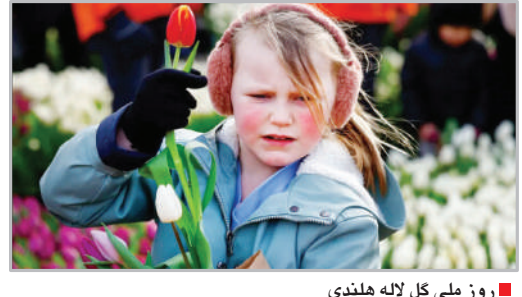
روز ملی گل لاله هلندی