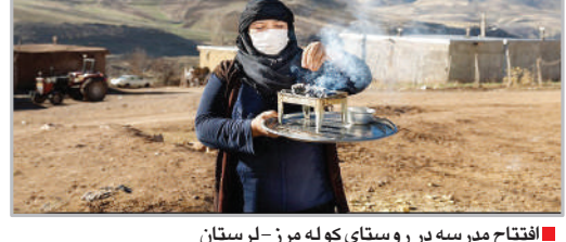
افتتاح مدرسه در روستای کوله مرز- لرستان