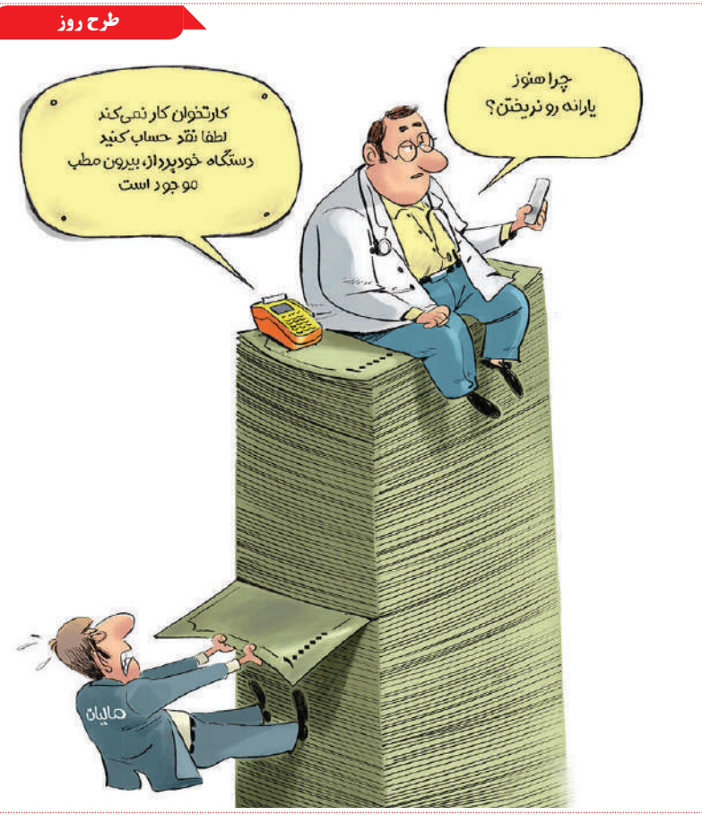
مالیات پزشکان منبع - خبر آنلاین

تصور عموم مردم از هوش مصنوعی و تابعان آن بر اساس ادبیات علمی-تخیلی شکل گرفته است که در آن‌ها ابرکامپیوترها و ربات‌های فوق هوشمند کار را از دست بشر درمی‌آورند و کنترل همه چیز را در دست می‌گیرند، اما حقیقت پیچیده‌تر از این است. در حالی که سیستم‌های هوش مصنوعی مستقل برای بسیاری از فناوری‌ها ضروری هستند، هوش آن‌ها عموماً به برنامه‌های خاص محدود می‌شود. مثلاً یک سیستم هوش مصنوعی که به عنوان نماینده خدمات مشتریان فعالیت می‌کند، هوشش در همان حد است و نمی‌تواند کنترل امور دنیا را به دست بگیرد. هوش افزوده حتی همان اختیار نسبی هوش مصنوعی