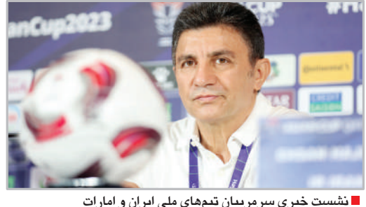
نشست خبری سرمربیان تیم‌های ملی ایران و امارات