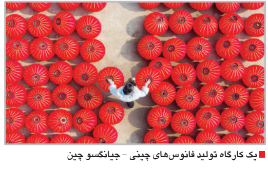
یک کارگاه تولید فانوس‌های چینی - جیانگسو چین